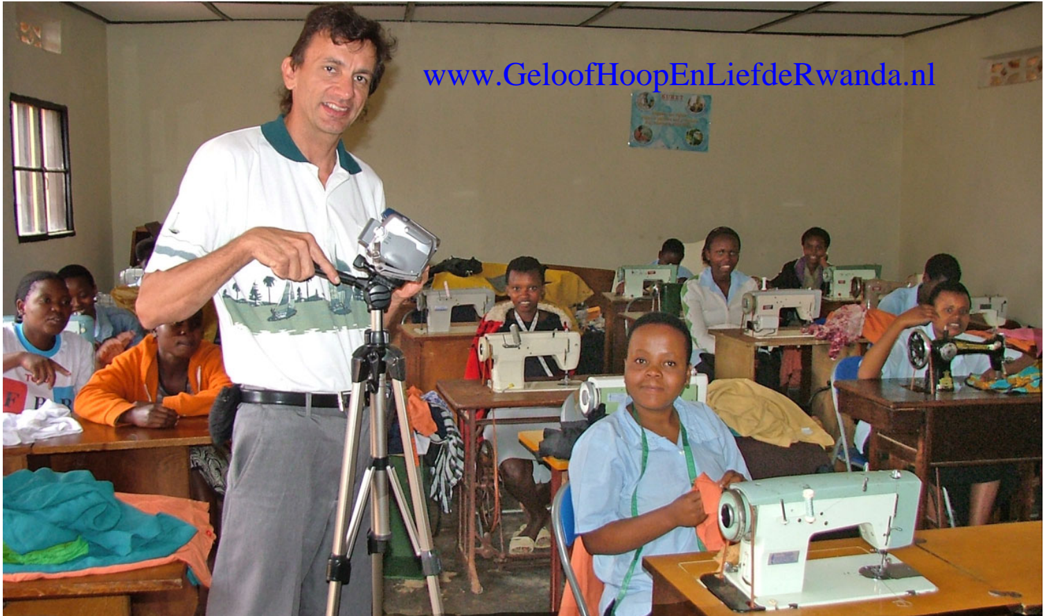
Maquinas de coser; regalados desde Holanda www.GeloofHoopEnLiefdeRwanda.nl

Recuerdas las noticias de 1994? En Abril de 1994 más de medio millón personas, incluidas mujeres y niños también, fueron horriblemente asesinados con machetes y palos, por gran parte por sus propios vecinos. Es difícil entender la gran escala de derramamiento de sangre y el caos que causo, mucho más cuando todo esto pasó dentro de unas semanas. Vecinos, asesinándose entre ellos mismos en forma tan despiadada. El resultado fue era una cantidad de aproximadamente un millón de huérfanos y mucha gente de edad quienes tuvieron que sobrevivir sin ninguna forma de entrada financiera. Quedaron muchas viudas, porque muchos jóvenes pelearon en la guerra y perdieron sus vidas. Muchas mujeres jóvenes y niñas fueron violadas y quedaron con niños no deseados.